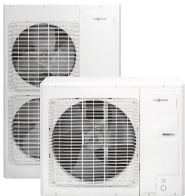
Unități exterioare pentru Vitocal 100-S/111-S